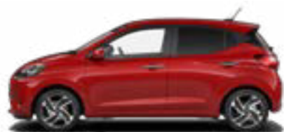
Dragon Red Pearl Kontrastdach verfügbar