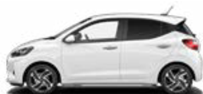
Atlas White Kontrastdach verfügbar