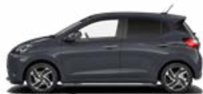
Aurora Gray Pearl