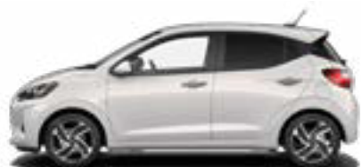
Lumen Gray Pearl Kontrastdach verfügbar