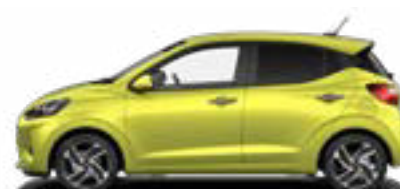
Lucid Lime Metallic Kontrastdach verfügbar