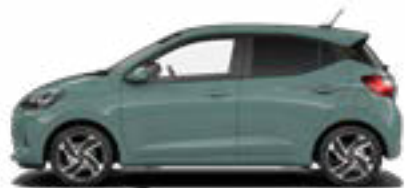
Mangrove Green Pearl Kontrastdach verfügbar