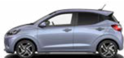
Meta Blue Pearl Kontrastdach verfügbar nicht für N Line